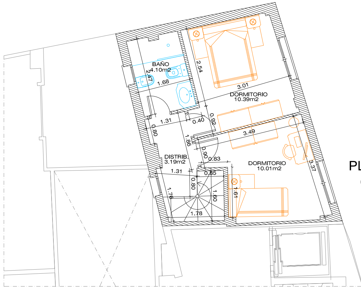
PLANTA 8ª (Duplex)